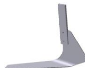
Н.043.01.020-19 Стойка с лапой левой m = 1,37 кг.