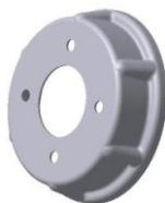
УСМК-5,4В.03.018 Обод наружный Материал: ОК360. m = 0,58 кг.