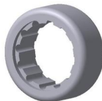
ТУ 381045-81 Шина 230x100