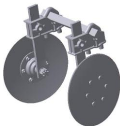
УСМК-5,4.23.100 Защитные диски m = 10,12 кг.

Примечание: В комплект поставки секции, рабочие органы не входят. *Опция, поставляется по заказу покупателя.