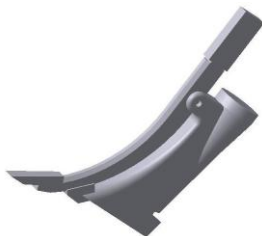
СМЕ-90.500 Нож подкормочный m = 5,42 кг.